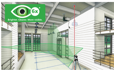
* Approx. 6 times brighter than a typical red laser with 630 - 660 nm

Deze automatische kruislijnlaser is ideaal voor de uitlijning van horizontale en verticale lijnen en hellingen. Dankzij de groene lasertechnologie wordt een uitstekende zichtbaarheid geboden. Een extra loodlaser en de referentiestraal maken synchroon werken op vloer en plafond mogelijk. Optische signalen waarschuwen de gebruiker als het nivelleerbereik wordt verlaten. Voor grote afstanden beschikt het apparaat over een geïntegreerde handontvangermodus. Met de in hoogte verstelbare console kan de laser op een statief, direct op de wand of op metalen oppervlakken worden bevestigd. De pendelvergrendeling is bedoeld voor een veilig transport.