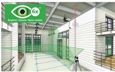
* Approx. 6 times brighter than a typical red laser with 630 - 660 nm