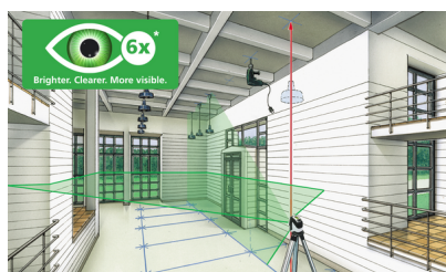
* Approx. 6 times brighter than a typical red laser with 630 - 660 nm